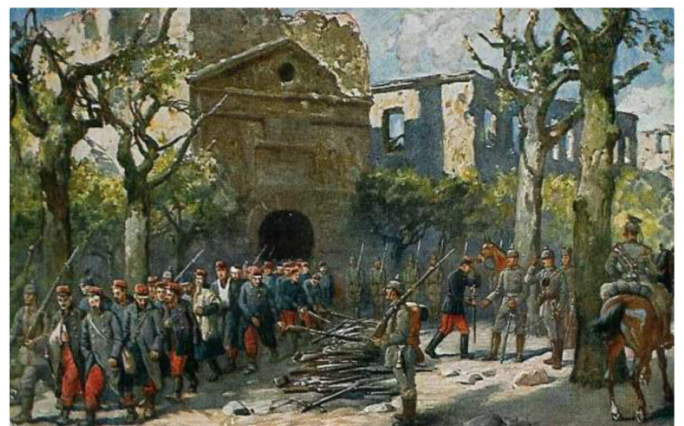
Reddition de Longwy Collection privée